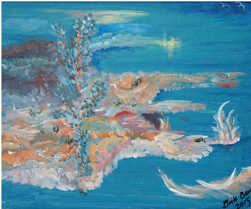
Änglaljus – Akryl på canvas, 30x40 cm