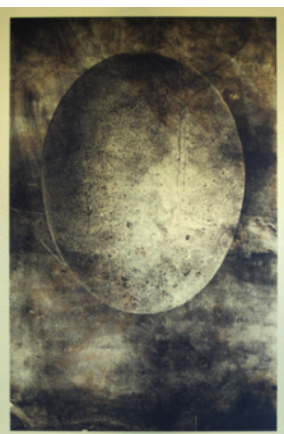
Saorsa (From the old Irish "Sairse" meaning Freedom, salvation, liberty)