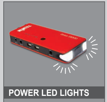
POWER LED LIGHTS