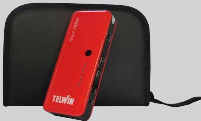
LEATHER CARRY CASE