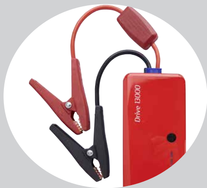
JUMP START CABLES