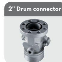
2" Drum connector