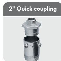
2" Quick coupling