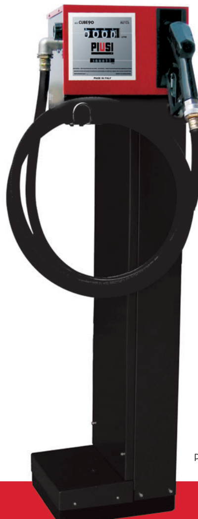
Pedestal on request