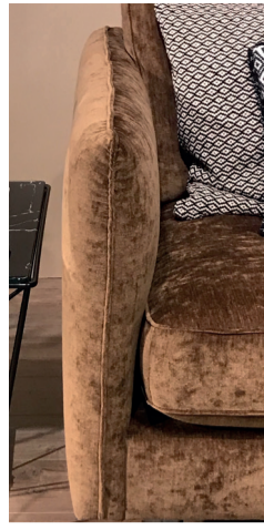
Armstöd A 12cm