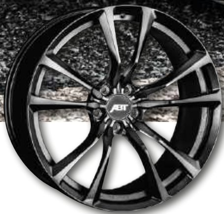
HIGH PERFORMANCE ER-F - BLACK MAGIC 19"