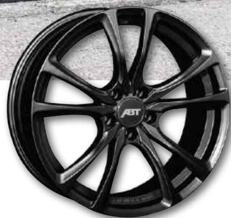
18" 19" 20" SPORT ER-C - MATT BLACK