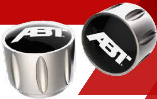
ABT VENTILKAPPEN ABT VALVE COVERS