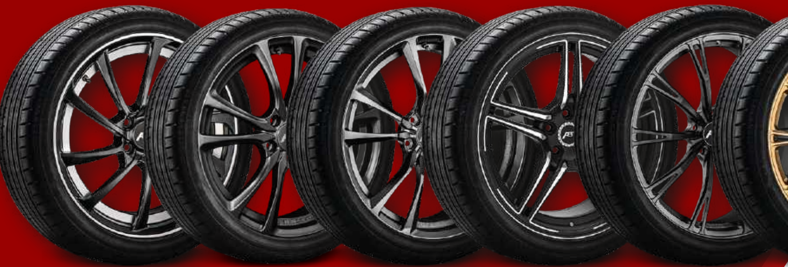
SPORT DR MYSTIC BLACK

MORE THAN JUST WHEELS. ABT COMPLETE WHEELS AND ACCESSORIES.