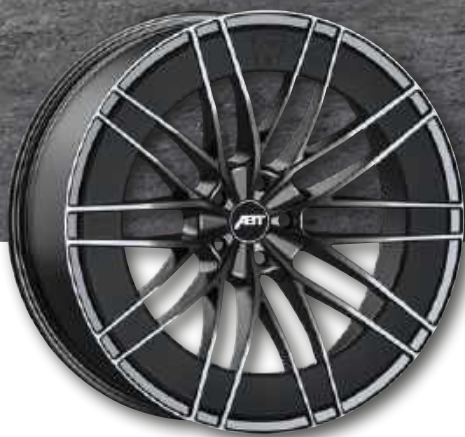
SPORT HR AERORAD 22"