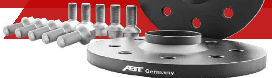
SPURVERBREITERUNG, ZENTRIERRINGE, RADSCHRAUBEN WHEEL SPACERS, CENTRING RINGS, WHEEL BOLTS