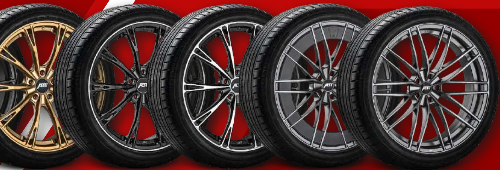
SPORT GR RACING GOLD MATT