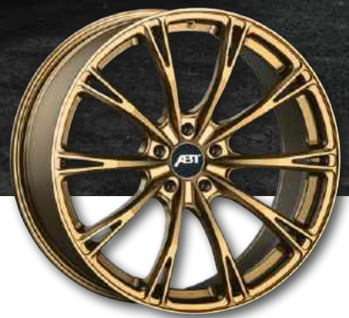
21" SPORT GR - RACING GOLD MATT