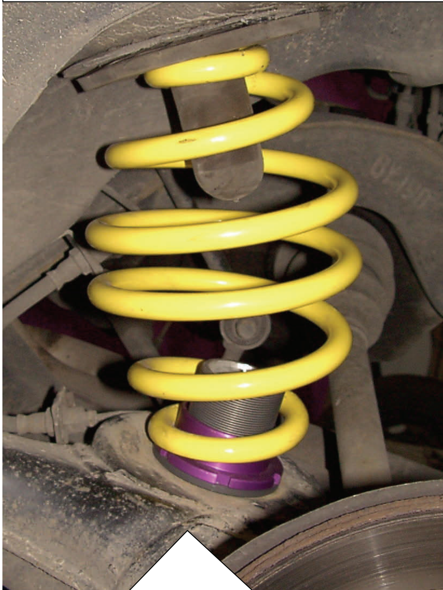
Abbildung nur beispielhaft / Example only

Die Höhenverstellung wird, wie im Bild zu sehen, unten (Achsseitig) eingesetzt, wobei die Berührungsflächen vor dem Einbau gereinigt werden müssen. Die obere Federunterlage mit Anschlagpuffer wird wie beim Seriefahrzeug eingesetzt und sollte sich in einwandfreiem Zustand befinden, ggf. gegen Neuteil ersetzen. Der Einbau des angelieferten Hinterachsdämpfers erfolgt gemäß der Einbauanleitung des Fahrzeugherstellers.