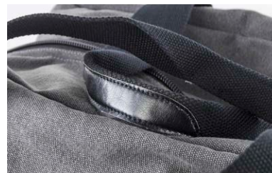
Snygga konstläder-detalljer på bärhandtagen