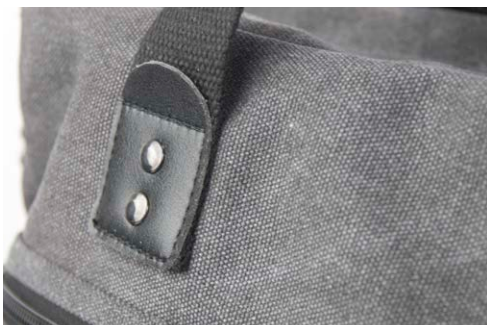
Snyggt canvasmaterial av hög kvalitet och stilrena detaljer.