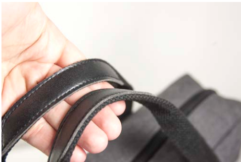
Bärhandtag med detaljer i konstläder.