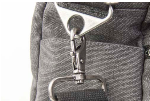
Metallspännen och avtagbart / justerbart axelband.