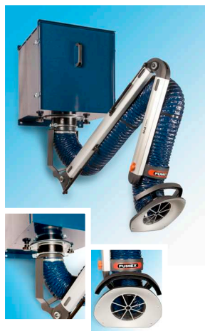
VF 2000 / VF 3000