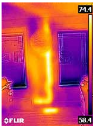
Varmt avloppsrör i väggen