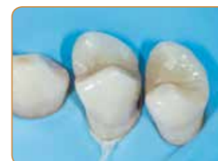
Ursprunglig situation med approximal karies.