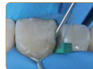
Applicering med G-ænial Universal Injectable (A2).