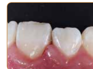
Resultat direkt efter behandling.