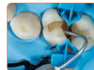
Underskår kan enkelt nås med de böjbara spetsarna.