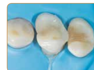
Applicering av slutgiltigt emaljskikt med färgen JE.