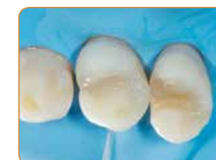
Slutgiltigt resultat efter finishering och polering av kantanslutningarna.