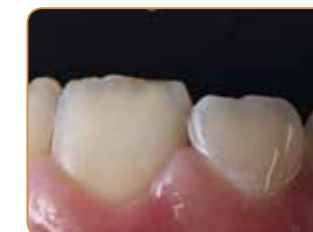
Perfekt integrering vid återbesök.