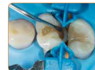
Approximalytan byggs upp med emalfärgen JE.