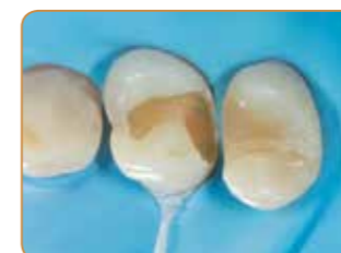
Den gamla restaurationen och karies avlägsnas.