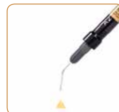
901503 - Långa applicerings-spetsar (30 st.)