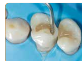
En klass I-procedur kan nu påbörjas: dentinskiktet skapas med färgen A4.