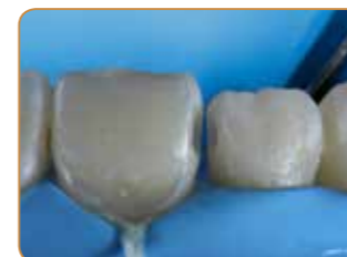
Ursprungliga klass III-kaviteter.