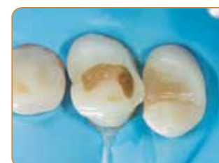
Matrisen avlägsnas efter att ytan byggts upp.