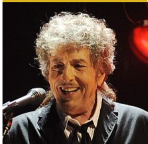
Bob Dylan.