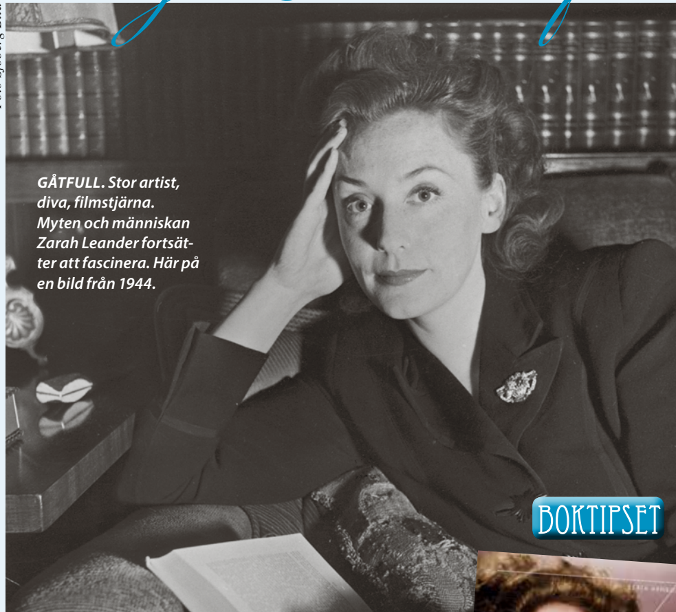
GÅTFULL. Stor artist, diva, filmstjärna. Myten och människan Zarah Leander fortsätter att fascinera. Här på en bild från 1944.