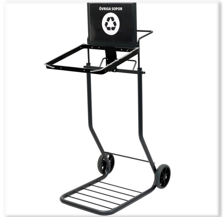
Komplett 29068 Activa Säckvagn Sortering