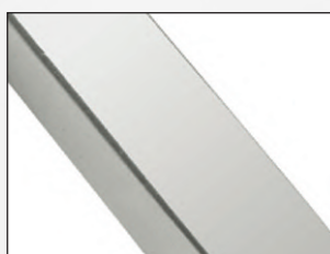
Ytbehandling matt krom