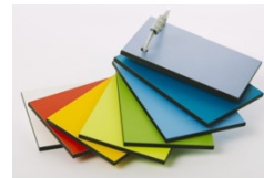
HPL och färger

Vårt högtryckslaminat (HPL) tål fukt och vatten och angrips inte av mögel eller röta. Det går även att högtryckstvätta panelerna om man t ex vill snygga till lekredskap som har blivit smutsiga. HPL, högtryckslaminaten är ett av marknadens tåligaste byggmaterial, det har hård motståndskraftig yta som det är oerhört svårt att göra intrycksmärken i.