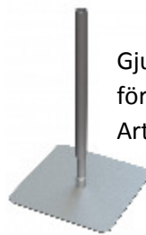
Gjutningsfritt fundament för rutsch och klätterlek. Art.nr: MAT029.