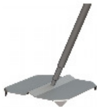
Gjutningsfritt fundament för gungor. Art.nr: MAT030.

I övrigt levereras våra produkter med förborrade hål varför monteringen sker men vagnsbult + bricka och mutter. Många delar kommer också förmonterade vid leverans. Vi har fått stort beröm för att våra produkter upplevs som enkla att montera.