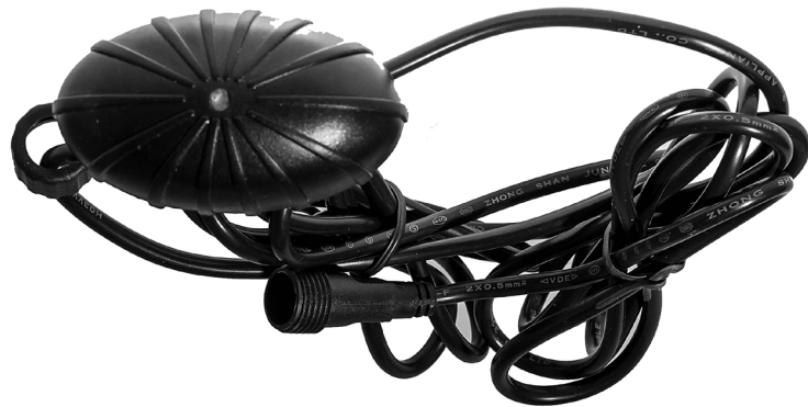
Lyssensor / Ljussensor

En defekt Aqualight LED 12 får inte slängas bland vanliga sopor utan behandlas som elavfall och lämnas på ex.vis en miljöstation. Pondteam är medlem i elkretsen för en hållbar elåtervinning och REPA när det gäller emballage.