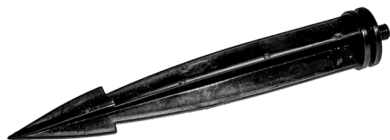
Jordspyd til lyssensoren / Jordspett till ljussensorn