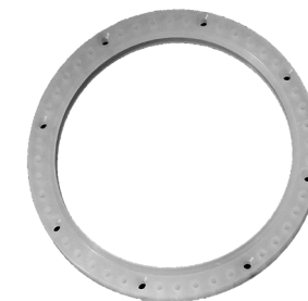
Silikonepakning. / Silikonpackning.