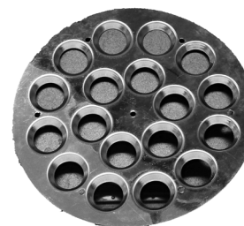
Beskyttelsesplade. / Skyddsplatta.