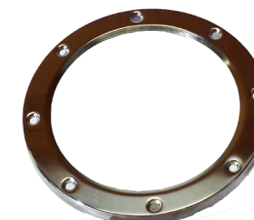
Låsering. / Låsring