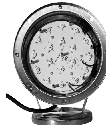
Printplade med LED dioder (Kan ikke udskiftes). Kretskort med LED dioder (kan inte bytas).

LED Spot Pro 18 W metal skal forbindes til lysnettet over en stikkontakt,