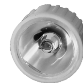
Reflektor til diode. Reflektor till diod.