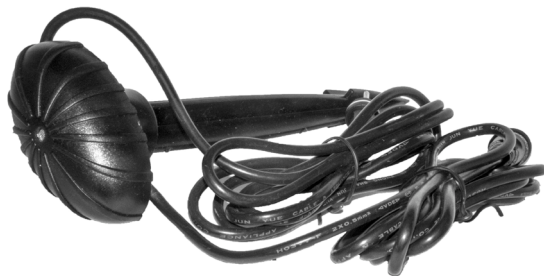
Ljussensor / Ljussensor

En defekt LED Spot Power 3 W får inte slängas bland vanliga sopor utan behandlas som elavfall och lämnas på ex.vis en miljöstation. Pondteam är medlem i elkretsen för en hållbar elåtervinning och REPA när det gäller emballage.