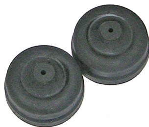
Membran artnr. 30641