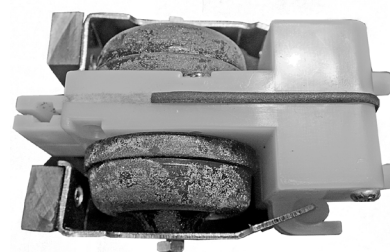
Dobbelt membrankammer med membraner artnr. 30623. Dubbel luftkammare med membran artnr. 30623.