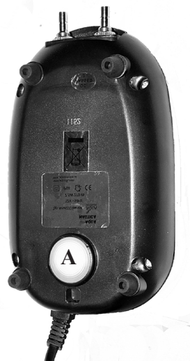
Airflow 300 LV bund. A= luftfilter. Airflow 300 LV:s botten. A = Insugsfiler.