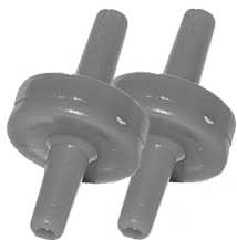
Kontraventiler artnr. 30654 . Backventil artnr. 30654 .