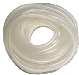
Luftslange (2 x 5 meter) artnr. 50540 (100 m x 4/6 mm). Luftslang (2 x 5 meter) artnr. 50540 (100 m x 4/6 mm)