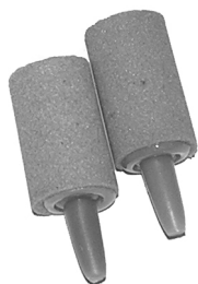
Luftsten artnr. 30648 . Syresten artnr. 30648