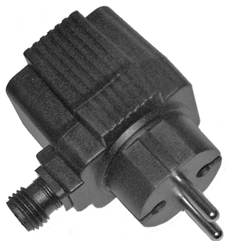
Transformator 12 Volt 10,5 watt IP44 Artnr. 60328