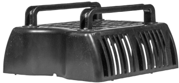
Øverste filterkammer / Övre filterkåpa