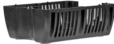
Nederste filterkammer / Undre filterkåpa