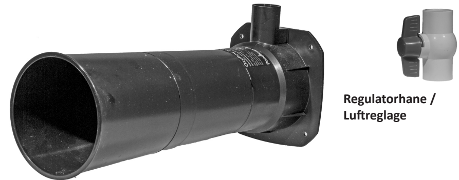
Regulatorhane / Luftreglage

En defekt luftpumpe må ikke smides i den normale dagrenovation, men skal indleveres på en af hjemkommunens genbrugspladser for el-materiel, f.eks. en miljøstation.