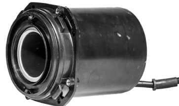
Pumpemotor / Pumpmotor