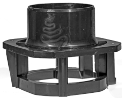
Rotorkammer / Rotorlock