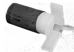
Rotor Art.nr. 30743