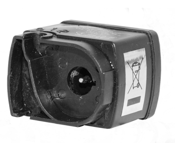
Pumpedel / Pumpdel