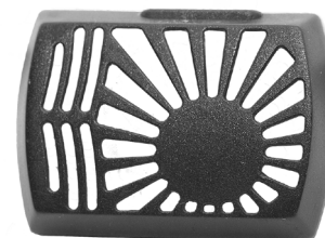
Indsugningsdæksel / Insugsgaller