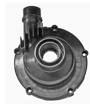
Rotorlåg / Rotorlock