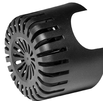
Filterhus / Filterkåpa

En defekt pumpe må ikke lægges i den normale dagrenovation, men skal afleveres på en af hjemkommunens genbrugspladser for el-materiel, f.eks. en miljøstation.