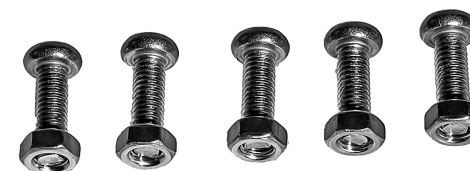
Rotorlågets 5 skruer med tilhørende møtrikker. / Rotorlockets 5 skruvar med tillhörande muttrar.