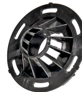
Filterhusets bagplade / Filterkåpans bakstykke