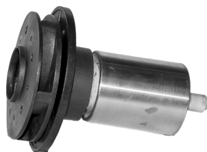
Rotor / Rotor

Motorhus med rotorbrønd. Bemærk de to tappe ved A og B. De skal passes ind i hullerne på rotorens bagplade. / Pumphus med rotorbrunn. Lägg märke till de två tappar vid A och B. Dessa ska passas in i hållen på baksidan av rotorns "rotorblad".