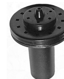
Fontænedyse / Fontänmunstycke