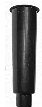
Klokedyse / Klockmunstycke

Tovejsventil Vær forsigtig ved samling, da denne del kan revne ved for kraftig pres. Tvåvägsventil Var försiktig när du sätter ihop delarna 2 då de annars kan spricka