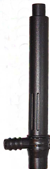
Teleskoprör / Teleskoprör