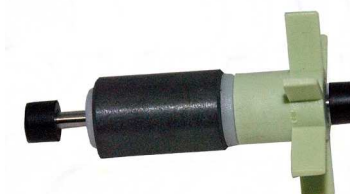
Rotor SJ 750: Artnr. 30813 Rotor SJ 1000: Artnr. 30814