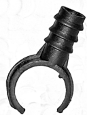
Lukkeklamme / Låsklämma