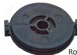
Rotorlåg / Rotorlock SJ 750: Artnr. 31422 SJ 1000: Artnr. 31423