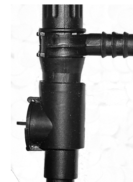
Tovejsventil med på- monteret teleskoprør / Tvåvägsventil med teleskoprør