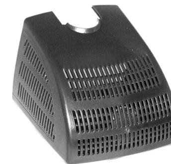
Filterhus / Filterkåpa