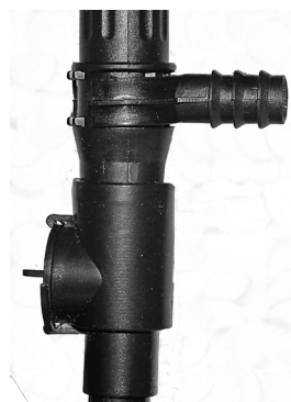
Tovejsventil med på- monteret teleskoprör / Tvåvägsventil med teleskoprör