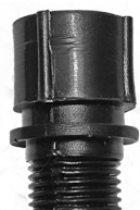
Afstandsstykke / Distanshylsa