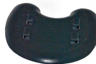
Fod / Fot