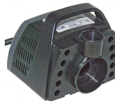
Pumpehus / Pumphus