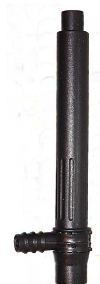
Teleskoprør / Teleskoprør