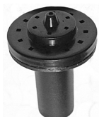
Fontænedyse / Fontänmunstycke