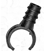
Lukkelemme / Låsklämma