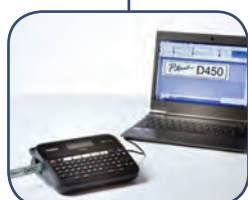
Koppla etikett skrivaren till din PC eller Mac