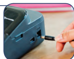
Använder 6 x AA- batterier* eller medföljande strömadapter