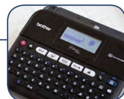
Inbyggd, redigerbar etikett design