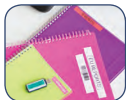
Skriver etiketter från 3.5 - 18 mm

Denna mångsidiga märkmaskin är den idealiska partnern på kontoret för att hjälpa dig och dina kollegor att hålla kontoret organiserat med tydlig identifiering av viktiga objekt.