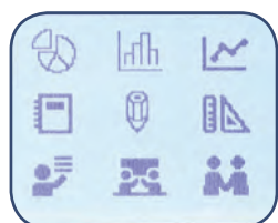
14 teckensnitt ; 99 ramar Mer än 600 symboler