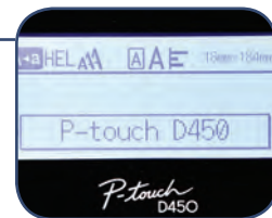
Grafisk display med förhandsvisning