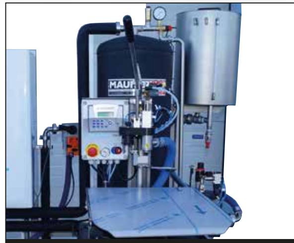
Halbautomatische Bag in Box Abfüllanlage