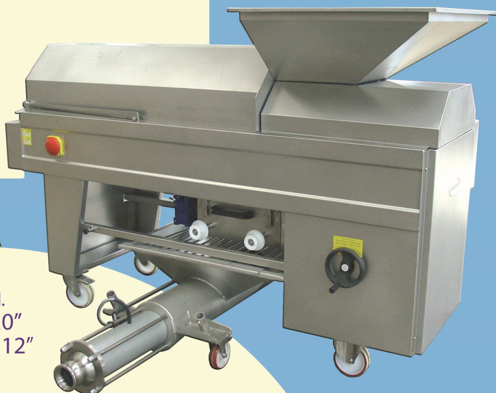
Mod. “P 120” & “PM 12”