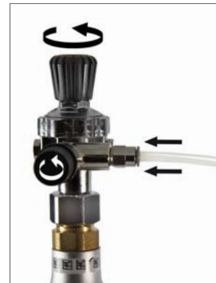
Tryck på slangen. Öppna toppventilen helt och hållet (obs: medsols), och vrid tillbaka den ett 1/4 varv.