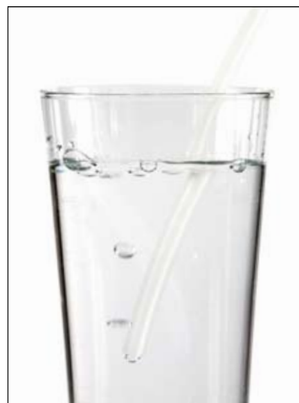
Håll ner slangen i ett glas med vatten. Vrid på sidokranen motsols(!) till det kommer rätt antal bubblor.