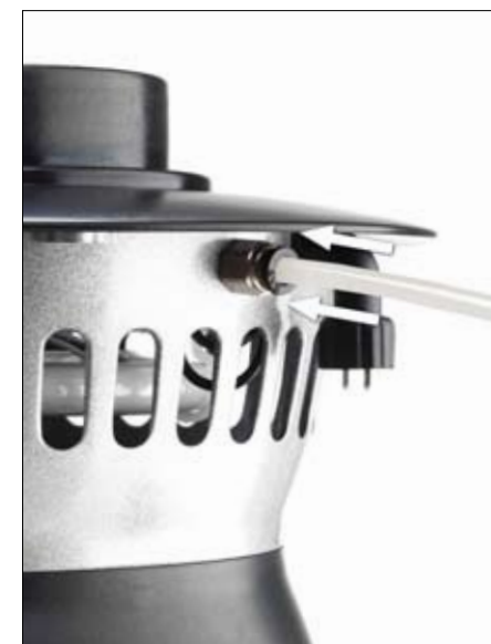
Stick in slangen i quick-fix-nippeln som sitter under hatten, bredvid elkontakten.