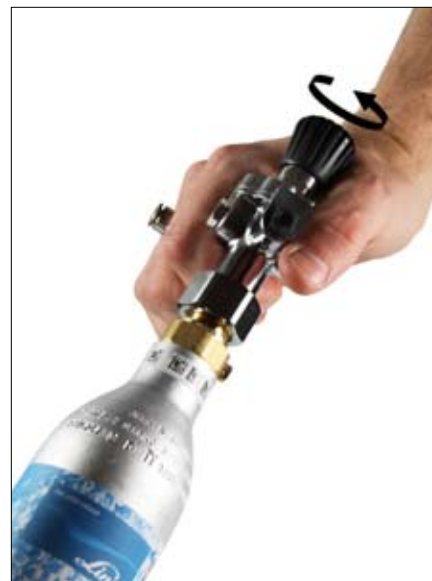
Skruva på regulatorn på flaskan (med handkraft) tills luften "pysar till", skruva vidare till det blir tyst.

OBS! Kontrollera veckovis flödet av bubblorna och att byt flaska när den är tom!