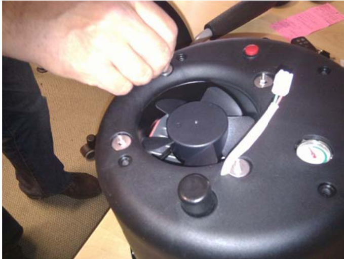
Skruva loss ytterhöljet (4 st muttrar)