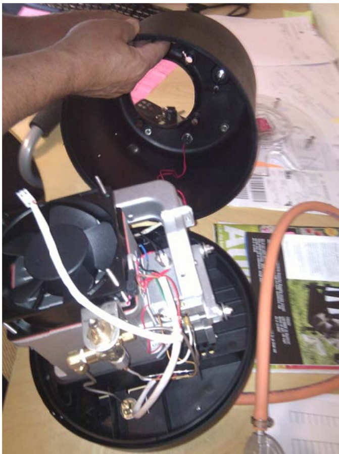
Lyft av ytterhöljet