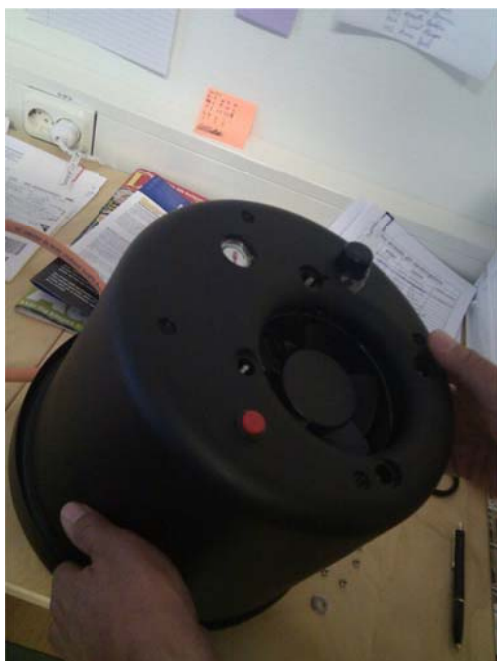
Sätt tillbaka ytterhöljet försiktigt