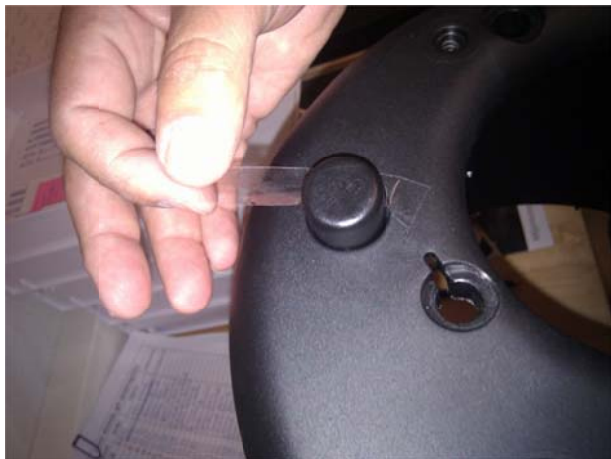
Tejpa fast gasflödesknappen för enklare montering