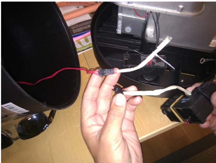
Koppla ur sladdarna från den traskiga tändmekanismen, #1