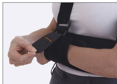
Handledsmanschetten kan öppnas separat vid träning.