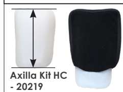
Axilla Kit HC - 20219

Bestilles separat, ved behov for individuell tilpasning eller ved behov for ekstra innerplate for hygiene/vask.