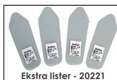
Ekstra lister - 20221

For økt stabilitet og kompresjon ved arm med større omfang. 1 alt. 2 lister settes inn i respektiv sidelomme.