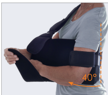
Kohotus 40 astetta.