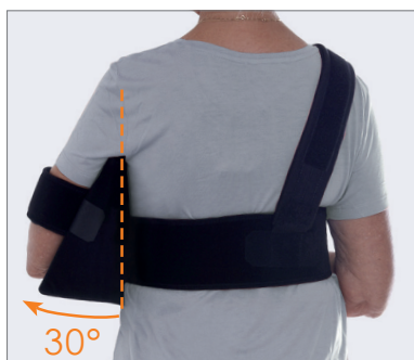
Loitonus 30 astetta.