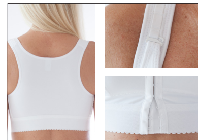
Bryderryg. Justerbar front og i skulderstropperne.