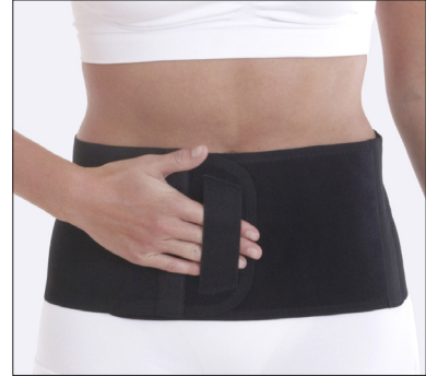
50211: 16 cm