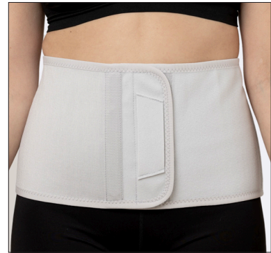
50212: 20 cm