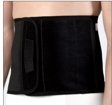
50210: 25 cm