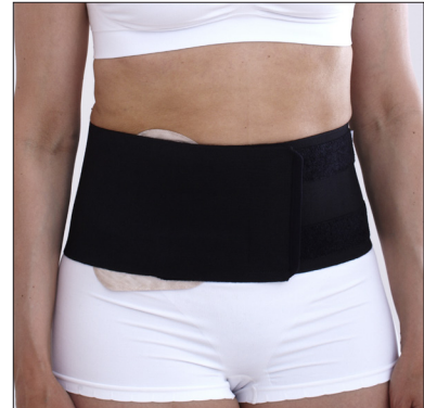
ViraRak 15 cm, 50230