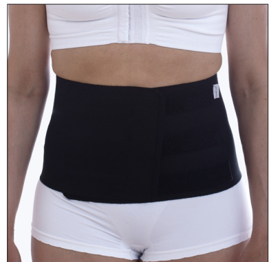
ViraRak 20 cm, 50231