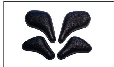
50257-00-50 Pads, Medium, 50257-00-60 Pads, Large