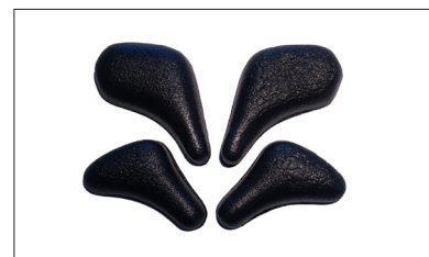
50257-00-50 Pads, Medium, 50257-00-60 Pads, Large