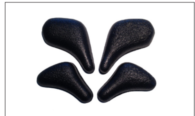
50257-00-50 Pads, Medium, 50257-00-60 Pads, Large