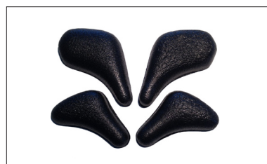
50257-00-50 Pads, Medium, 50257-00-60 Pads, Large