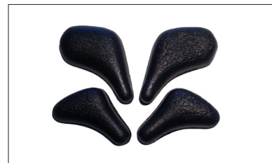
50257-00-50 Pads, Medium 50257-00-60 Pads, Large