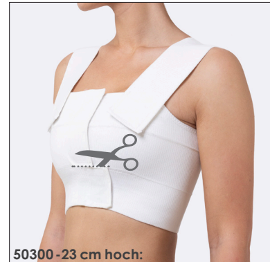
50300 - 23 cm hoch:

Für eine körpernahe Passform bei größerer Oberweite schneiden Sie zwischen den Stoffabschnitten in die gestrickten Bruchkanten.