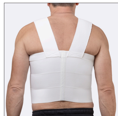
50301 - 30 cm hoch