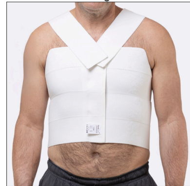
50301 - 30 cm hoch

Für eine körpernahe Passform bei größerer Oberweite schneiden Sie zwischen den Stoffabschnitten in die gestrickten Bruchkanten.