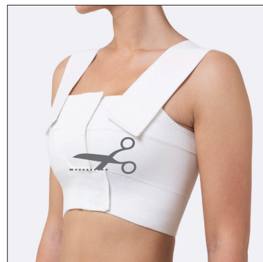
50300 - 23 cm høj: For bedre pasform ved større barm, klip mellem syningerne.