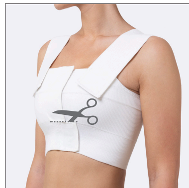
50300 - 23 cm høy: For bedre passform for større byster, klipp mellom sømmene.