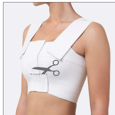
50300 - 23 cm hög: För bättre passform vid större byst, klipp mellan våderna.