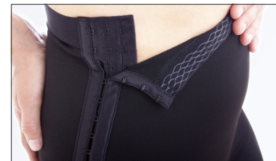
Hægte og krog lukning på begge sider samt silikone i linningen.