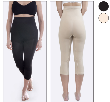
Silikone kant i taljen.