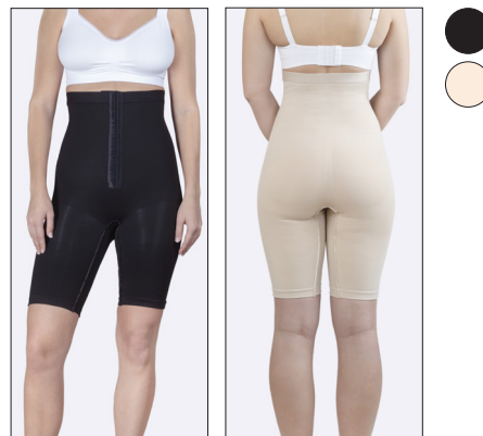
Silikone kant i taljen.