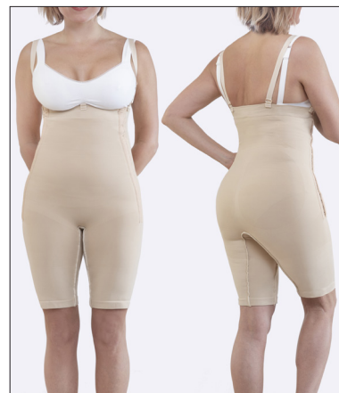
Hekte- og krok-knepping på begge sider og avtakbare skulderbånd.